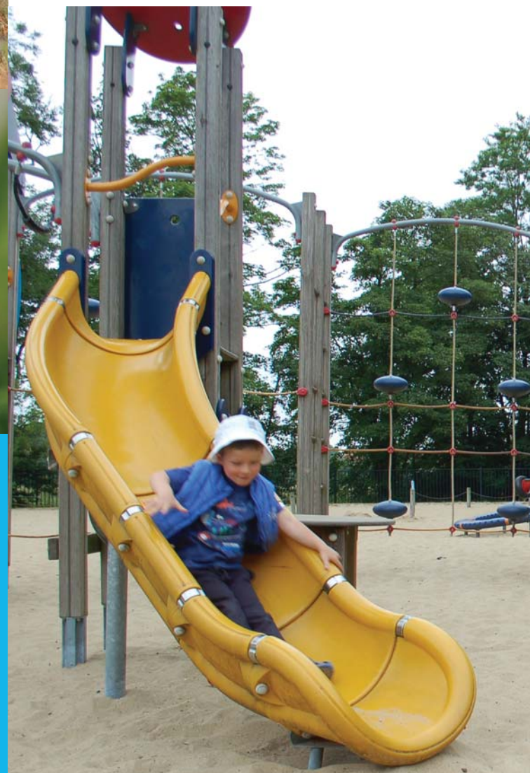
speeltuin in De Ceder

Vanuit het NMBS-station van Deinze is er een rechtstreeks wandel- en fietspad van ongeveer een kilometer tot de hoofdingang bij de begraafplaats van Astene.